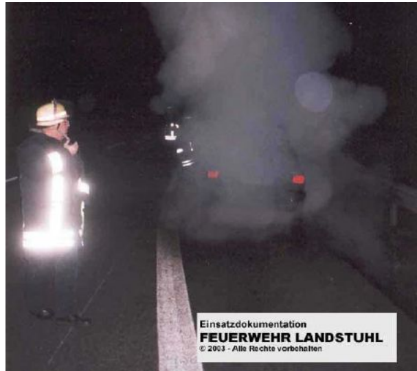
Einsatzdokumentation FEUERWEHR LANDSTUHL