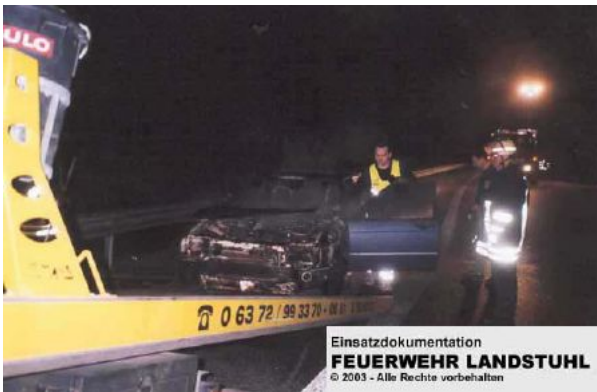
Einsatzdokumentation FEUERWEHR LANDSTUHL © 2003 - Alle Rechte vorbehalten

13. Februar 2002 | 15:42 Uhr Erdbeben am Hörchenbergtunnel - A62 Einsatzbericht: [keine Angaben]