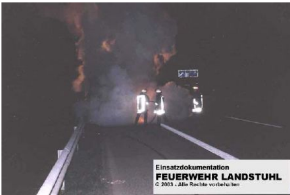
Einsatzdokumentation FEUERWEHR LANDSTUHL © 2003 - Alle Rechte vorbehalten

27. März 2002 | 03:36 Uhr Pkw- Brand - A62 Einsatzbericht: [keine Angaben]