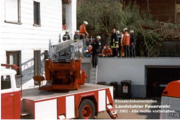
Einsatzdokumentation Landstuhler Feuerwehr © 2002 - Alle Rechte vorbehalten

27. März 2002 | 03:36 Uhr Pkw- Brand - A62 Einsatzbericht: [keine Angaben]